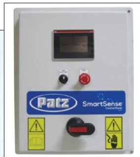
コントロールパネル